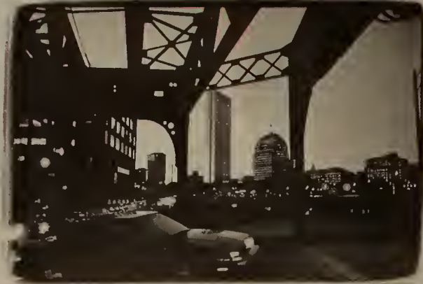
Chinatown at Herald Square

The artist/student teams spend a day each week, photographing various aspects of life along the Washington Street Corridor, including people, buildings and views of the Elevated Orange Line—its activity and physical structure. The teams have already begun compiling their